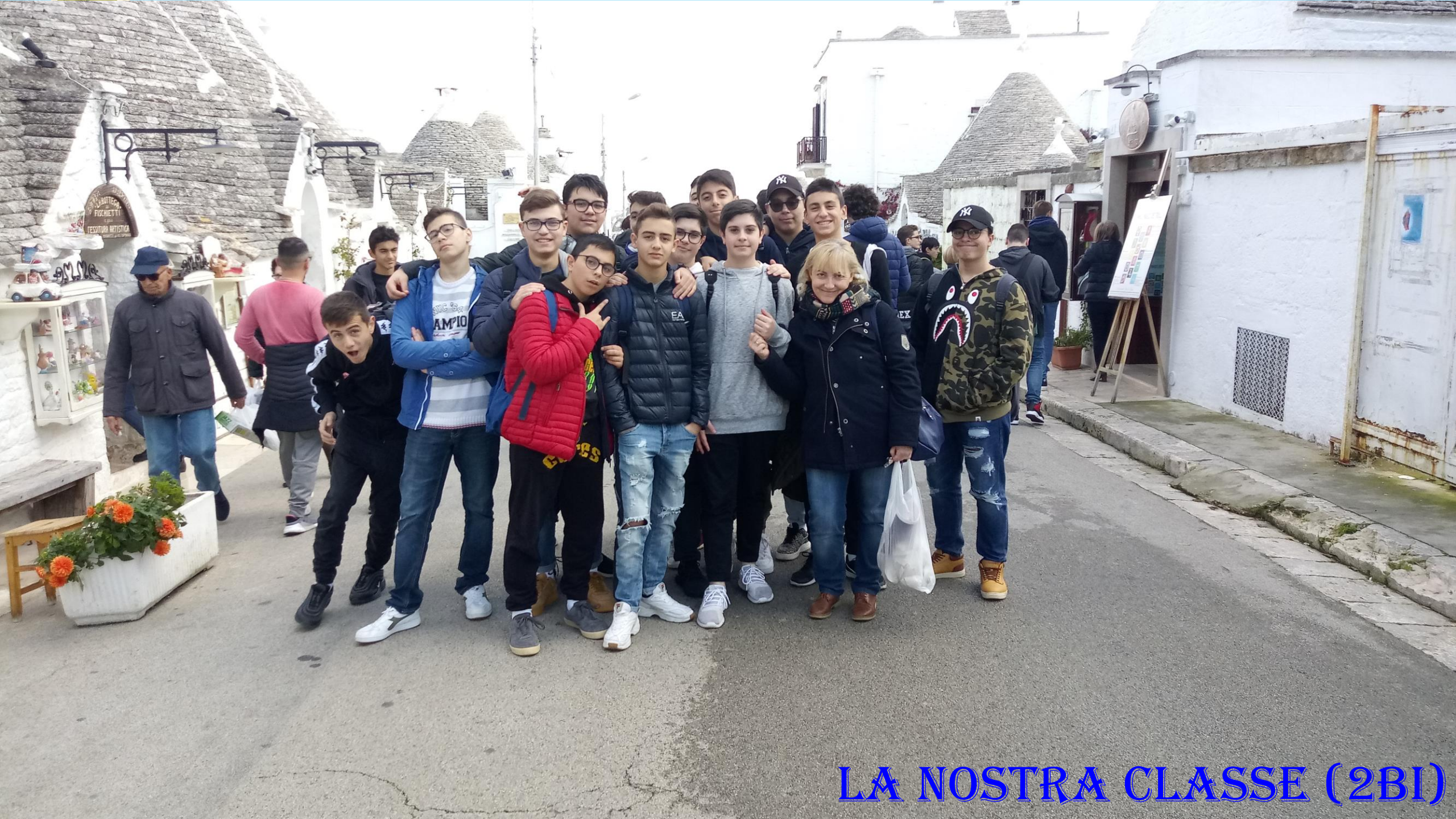
LA NOSTRA CLASSE (2BI)